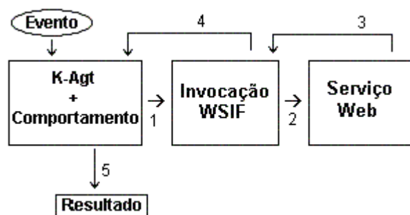
Figura 3 – A invocação e a resposta do serviço

tipo de serviço requerido (passo 3), para a classe de invocação. Essa resposta é retornada ao K-Agt (passo 4), que exibirá o resultado da requisição (passo 5).