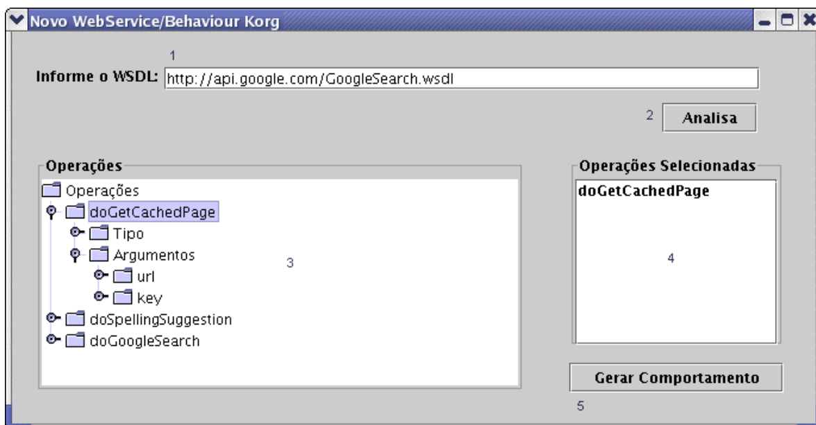
Figura 1 – Configuração de comportamentos

Para a geração do comportamento, o usuário deve, primeiramente, escolher qual operação do serviço o comportamento irá utilizar. As operações selecionadas são listadas no item 4 da figura 1. Após isso, o comportamento pode ser gerado através do botão Gerar Comportamento, no quinto item, onde é gerada uma classe de comportamento com os métodos do Serviço Web selecionados pelo usuário. A partir desse momento, essa classe é cadastrada na biblioteca de comportamentos do K-Org, ficando disponível para que seja utilizada em qualquer K-Agt que necessitar das operações deste Serviço Web .